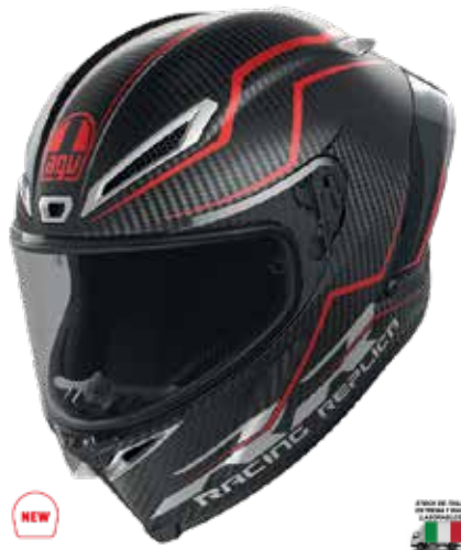
PERFORMANCE CARBON/RED 1540 EUR IVA Inc