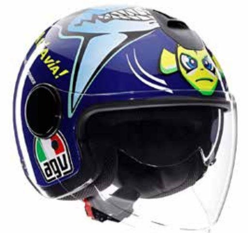
ROSSI MISANO 2015 199 EUR IVA Inc