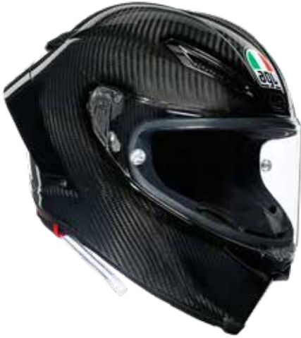
MONO GLOSSY CARBON 1430 EUR IVA Inc