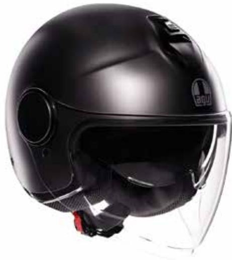
MONO ASFALTO GREY 139 EUR IVA Inc