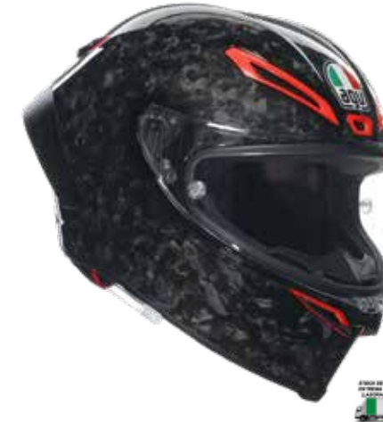
ITALIA CARBONIO FORGIATO 1815 EUR IVA Inc