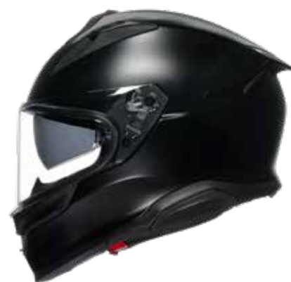
BLACK 479 EUR IVA Inc