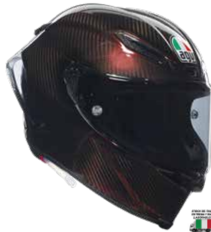
MONO RED CARBON 1480 EUR IVA Inc