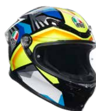
JOAN BLACK/BLUE/YELLOW 529,95 EUR IVA Inc