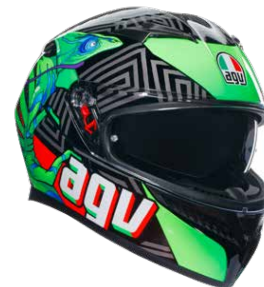
KAMALEON BLACK/RED/GREEN 269 EUR IVA Inc