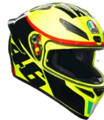
GRAZIE VALE 279 EUR IVA Inc