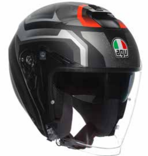
NEW ZURIGO MATT BLACK GREY 199 EUR IVA Inc