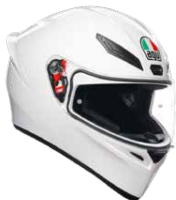
WHITE 199 EUR IVA Inc