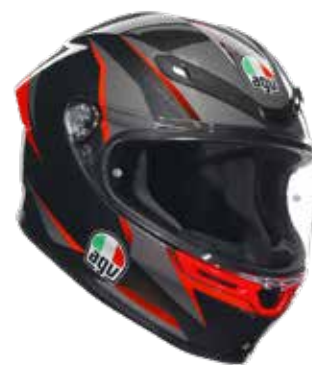
SLASHCUT BLACK/GREY/RED 529EUR IVA Inc