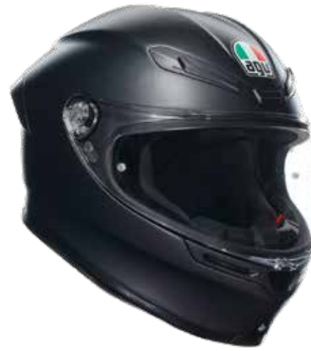
MATT BLACK 479 EUR IVA Inc