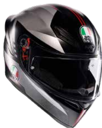
LAP MATT BLACK/GREY/RED 239 EUR IVA Inc