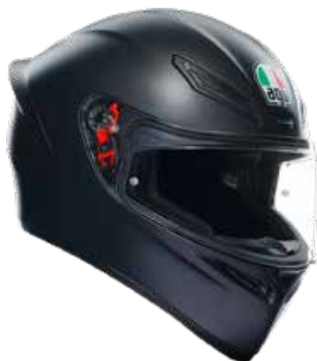
MATT BLACK 209 EUR IVA Inc