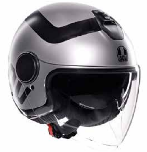
RIMINI MATT GREY/BLACK 159 EUR IVA Inc