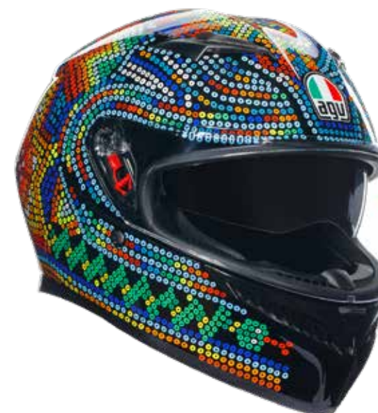
ROSSI WINTER TEST 2018 299 EUR IVA Inc