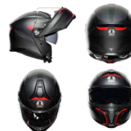
FREQUENCY MATT GUNMETAL 201251E40Y 005