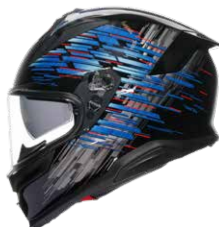
GENESYS MATT BLACK BLUE GREY 549 EUR IVA Inc