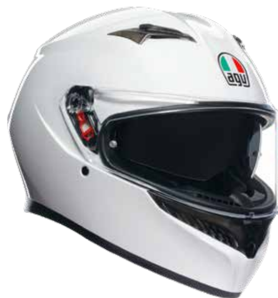
SETA WHITE 219 EUR IVA Inc