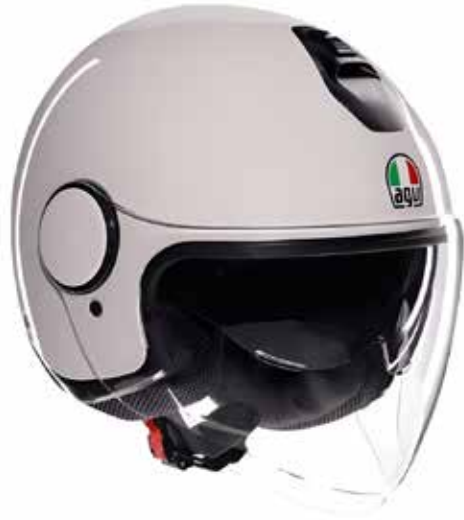
MONO MATERIA WHITE 129 EUR IVA Inc