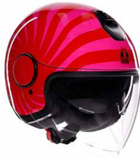
TROPEA RED/PINK 159 EUR IVA Inc