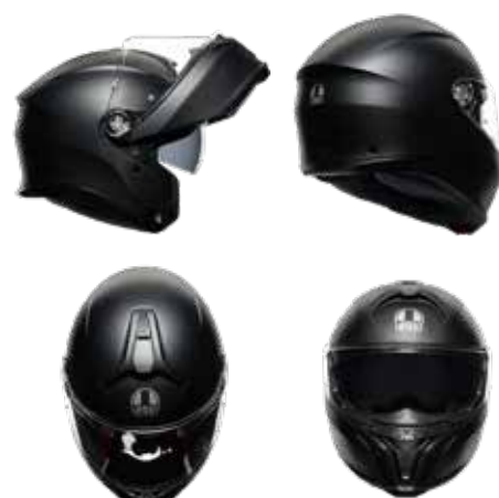
NEGRO MATE 201251E40Y 003