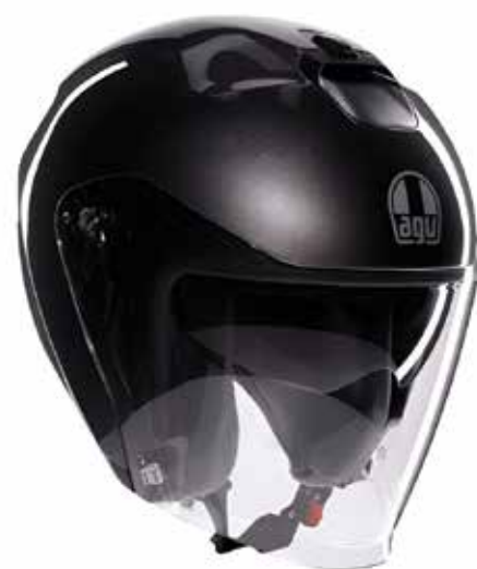
MONO MATT PREGIATO BRONZE 169 EUR IVA Inc