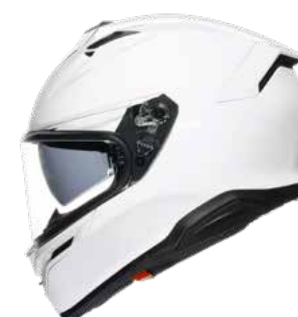
WHITE 479 EUR IVA Inc