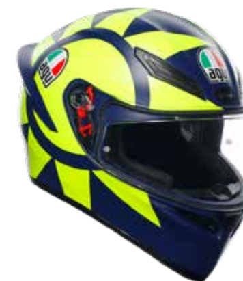
SOLELUNA 2018 279 EUR IVA Inc