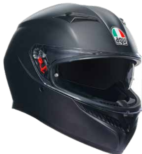
MATT BLACK 229 EUR IVA Inc