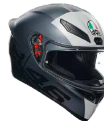
LIMIT 46 2795 EUR IVA Inc