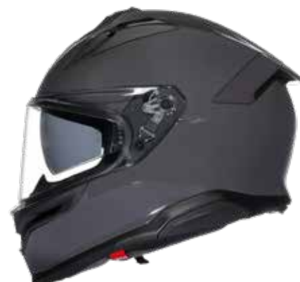
EVO GREY 479EUR IVA Inc