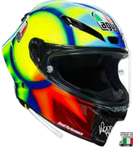
SOLELUNA 2021 1815 EUR IVA Inc