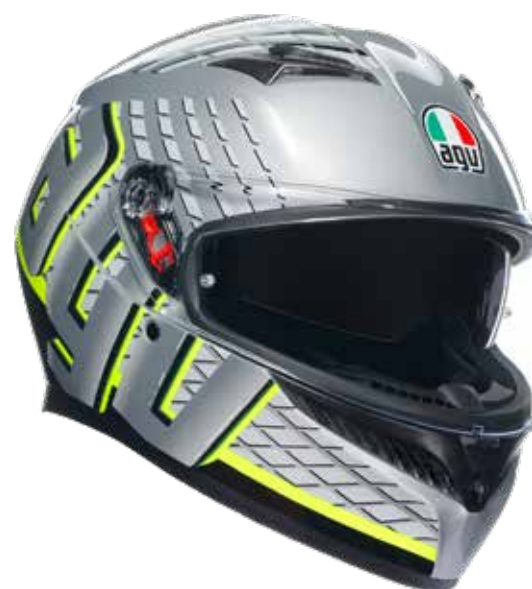
FORTIFY GREY/BLACK/YELLOW FLUO 269EUR IVA Inc