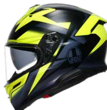
GLIMPSE BLACK MATT FLUO YELLOW 549 EUR IVA Inc