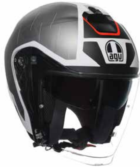
NEW TRIESTE MATT BLACK WHITE 199 EUR IVA Inc