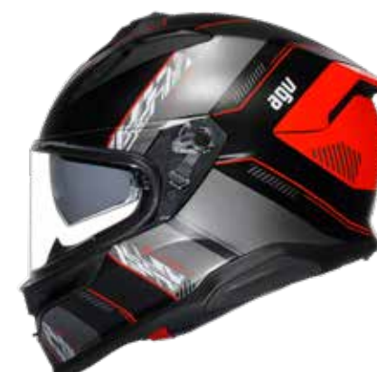
KYBER MATT BLACK RED 549 EUR IVA Inc