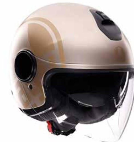
SIROLO WHITE/GOLD 159 EUR IVA Inc