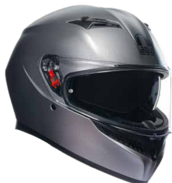
RODIO GREY MATT 229 EUR IVA Inc