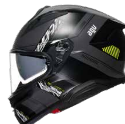
KYBER GREY MATT FLUO YELLOW 549 EUR IVA Inc