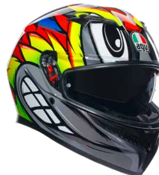
BIRDY 2.0 GREY/YELLOW/RED 269EUR IVA Inc