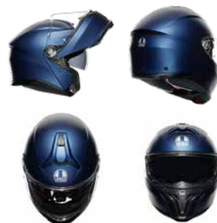
GALASSIA BLIE MATT 201251E40Y 004