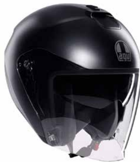
MONO MATT ARDESIA GREY 169 EUR IVA Inc