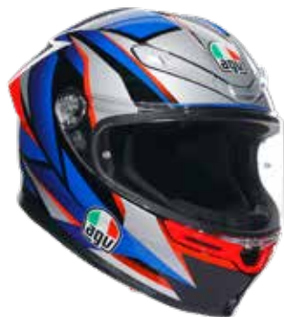
SLASHCUT BLACK/BLUE/RED 529 EUR IVA Inc