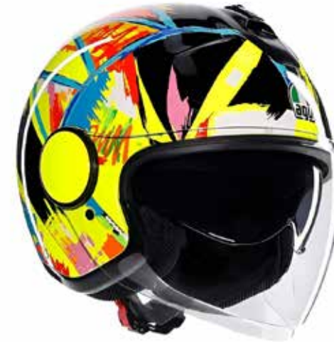
ROSSI WINTER TEST 2019 199 EUR IVA Inc