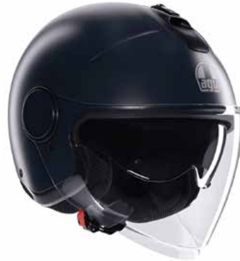
MONO MATT BLACK 139 EUR IVA Inc