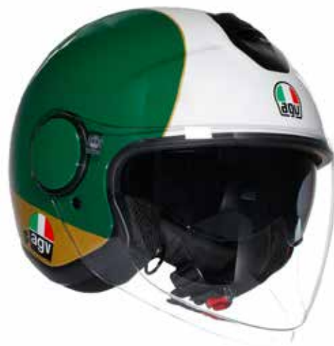
AGOSTINI 199 EUR IVA Inc