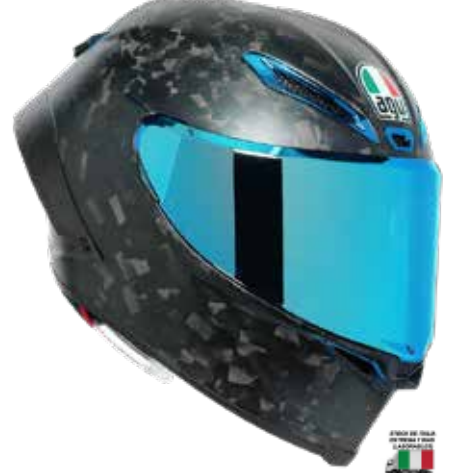
FUTURO CARBONIO FORGIATO 1815 EUR IVA Inc