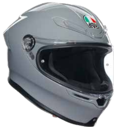
NARDO GREY 479 EUR IVA Inc