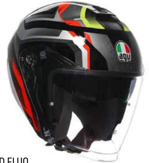
NEW ZURIGO BLACK RED FLUO 199 EUR IVA Inc