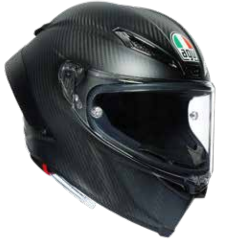
MONO MATT CARBON 1430 EUR IVA Inc