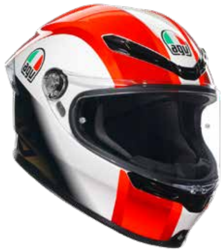
SIC58 559EUR IVA Inc