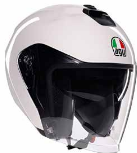
MONO MATERIA WHITE 159 EUR IVA Inc