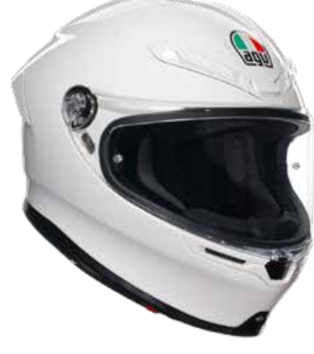
WHITE 449 EUR IVA Inc