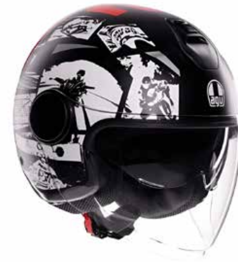
HISTORY MATT BLACK/WHITE/RED 159 EUR IVA Inc