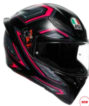
SLING BLACK/PINK 239 EUR IVA Inc