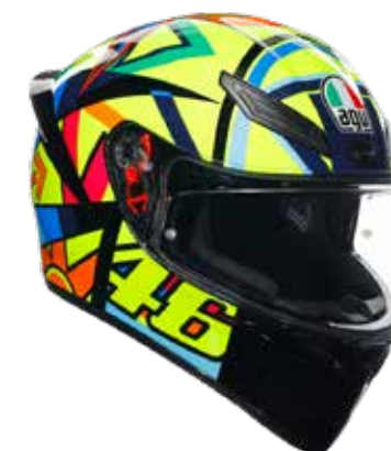
SOLELUNA 2017 279 EUR IVA Inc