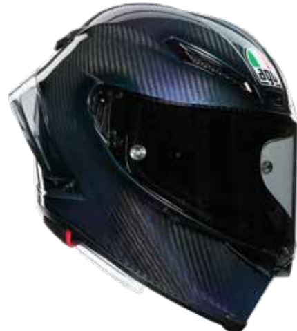
MONO IRIDIUM CARBON 1480 EUR IVA Inc