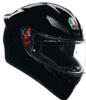
BLACK 199 EUR IVA Inc