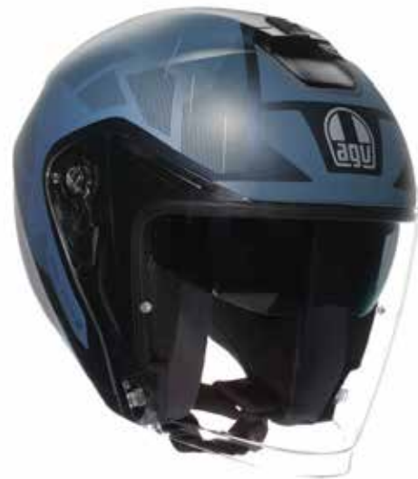
NEW TRIESTE MATT BLUE 199 EUR IVA Inc