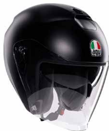
MONO MATT BLACK 169 EUR IVA Inc