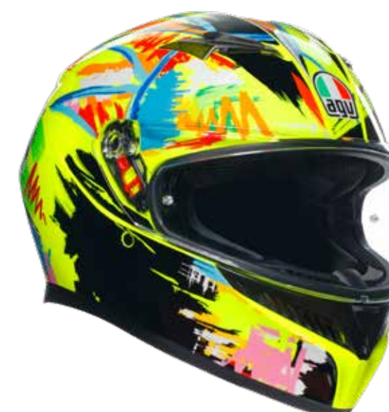
ROSSI WINTER TEST 2019 299 EUR IVA Inc