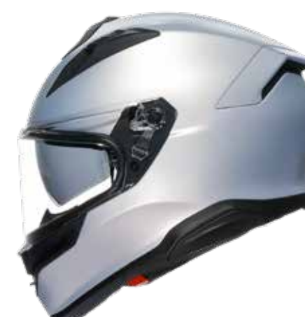
PRISMA SILVER 479 EUR IVA Inc